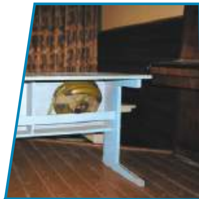
Террористы могут подложить взрывное устройство в любое место.

• В случае крайней необходимости, если надо убрать предмет, предварительно сдвиньте его при помощи длинной верёвки (лески) с