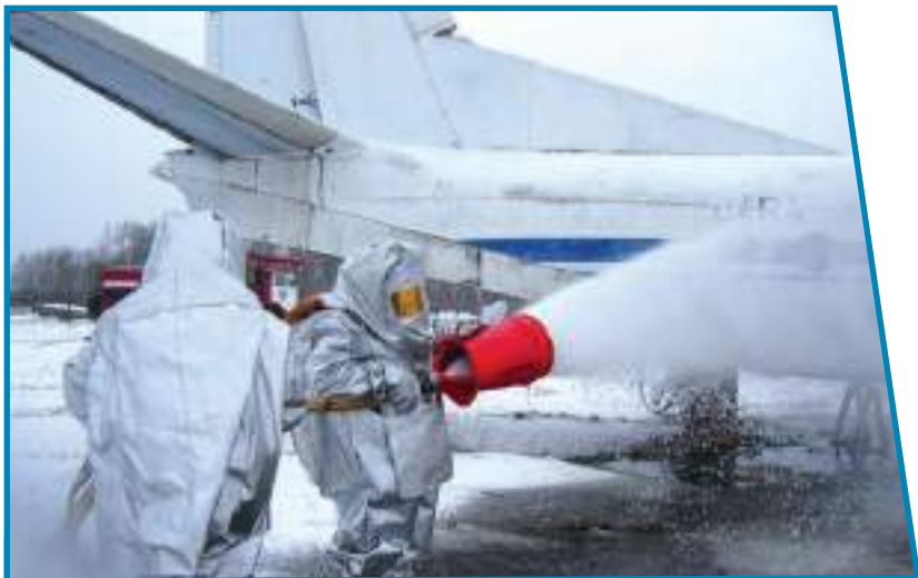
Бойцы войск гражданской обороны на тушении пожара.

Проведён комплекс долгосрочных мероприятий по противодействию идеологии терроризма.