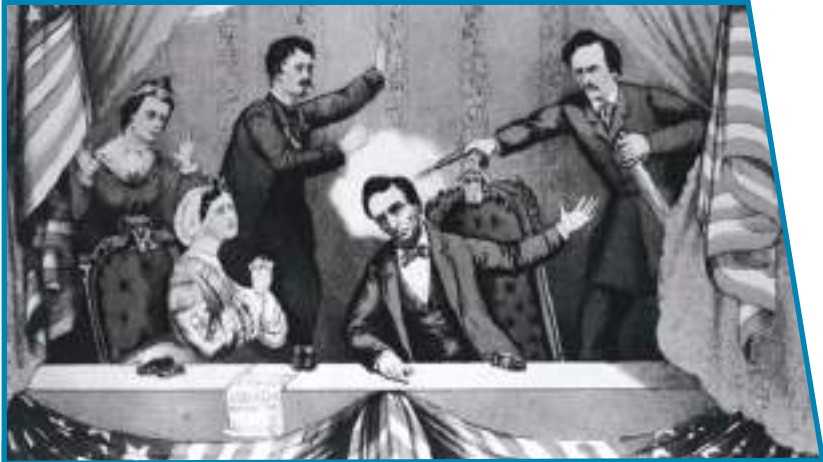
Убийство президента США А. Линкольна в театре. 1865 г.

профессией для радикально настроенных кругов — революционеров и националистов. Тогда же были выработаны основные формы и методы террористической деятельности, сформировались образцы стратегии и тактики террористов.