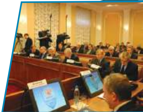
На заседаниях Национального антитеррористического комитета разрабатываются меры по противодействию терроризму.

Для организации планирования применения сил и средств федеральных органов исполнительной власти и их территориальных органов по борьбе с терроризмом, а также для управления контртеррористическими операциями в составе НАК образуется Федеральный оперативный штаб, а для управления контртеррористическими операциями в субъектах Российской Федерации — оперативные штабы, которые возглавляют руководители территориальных органов безопасности в субъектах Российской Федерации.