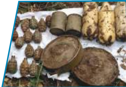
Ликвидирован бандитский тайник с боеприпасами.

Летом 2008 года была пресечена попытка местных террористов и эмиссара «Аль-Каиды» организовать теракты в городах Сочи и Анапа с применением мощных взрывных устройств. К ответственности было привлечено 198 боевиков.