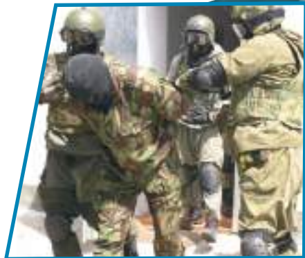
Террорист, удерживавший заложников, обезврежен бойцами спецназа.

Подразделения и воинские части Вооружённых Сил Российской Федерации привлекаются для участия в проведении контртеррористической операции по решению руководителя контртеррористической операции в порядке, определяемом нормативными правовыми актами Российской Федерации.