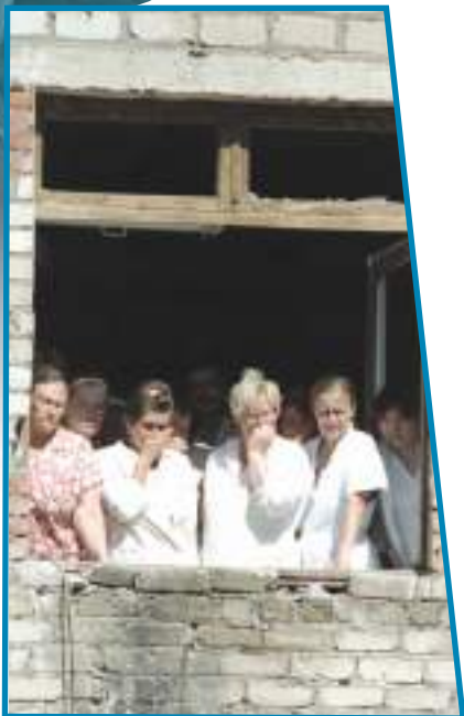
Заложники городской больницы г. Будённовска. 1995 г.

Пример: многолетняя деятельность Ирландской республиканской армии, целью которой являлось отколоть Северную Ирландию от Великобритании.