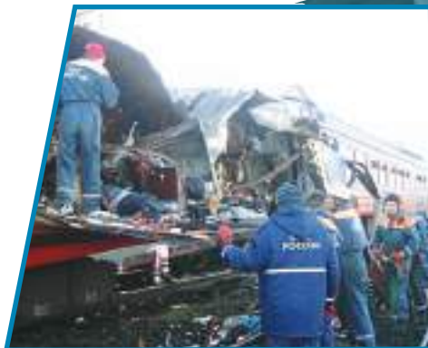
Подорвана электричка на участке Кисловодск — Минеральные Воды. 5 декабря 2003 г.

ядерного оружия, сложно, но вполне возможно. Многие террористические организации имеют большие финансовые ресурсы и связаны со спецслужбами различных стран. На современном этапе это явление превратилось в фактор, серьёзно дестабилизирующий нормальное развитие международных отношений. Особую опасность могут представлять террористические посягательства с использованием ядерных и иных средств массового поражения.