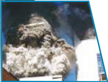
Взрыв Всемирного торгового центра. 11 сентября 2001 г.

международной антитеррористической коалиции, объявление терроризма главной опасностью для мировой цивилизации и возведение задачи уничтожения терроризма в ранг первоочередных проблем мирового сообщества.