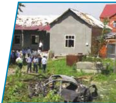
Покушение на президента Республики Ингушетии Ю.-Б. Евкурова. 2009 г.

Террористы хотят добиться решения своих преступных замыслов, посеять страх, запугать государственные органы,