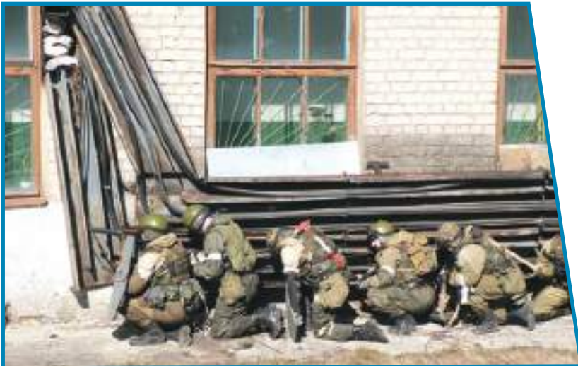
Бойцы спецназа перед штурмом здания, захваченного террористами.

Контртеррористическая операция проводится для пресечения террористического акта, если его пресечение иными силами или способами невозможно. Все военнослужащие, сотрудники и специалисты, привлекаемые для проведения контртеррористической операции, с момента начала операции и до её окончания подчиняются руководителю контртеррористической операции.