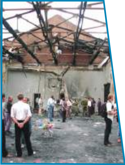
Руины школы №1 в г. Беслане.

ков под руководством арабского наёмника Хаттаба. Этот бой навсегда стал символом доблести российского солдата. Боевики пробивались из Аргунского ущелья в Дагестан, чтобы убивать простых людей и жечь всё на своём пути, а потом взять сотни заложников и выдвинуть политические требования. Сколько бед принесли бы в Дагестан эти озверевшие, загнанные в угол 2 тысячи бандитов, страшно даже представить. Но на их пути встали 90 бойцов парашютно-десантной роты, которая заняла оборону на господствующей высоте. Десантники выдержали несколько атак. На рассвете 1 марта после миномётного обстрела бандиты со всех сторон