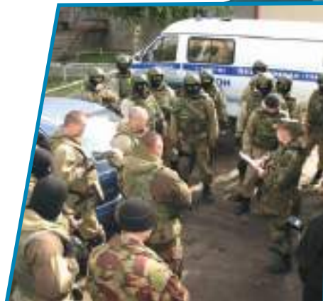
Подразделению спецназа ставят задачи перед выходом на операцию.

В 2008 году в качестве приоритетной для Национального антитеррористического комитета (НАК) являлась задача по снижению террористической угрозы в стране и предотвращению преступлений террористической направленности.