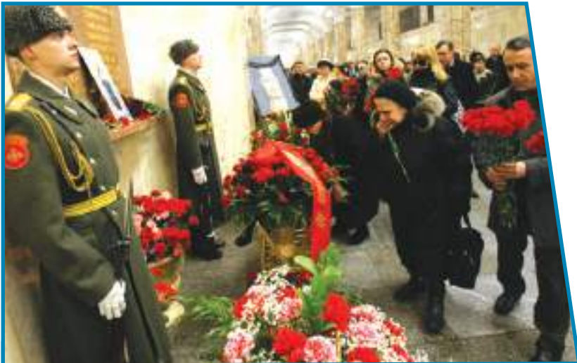
Акция памяти жертв теракта на станции «Автозаводская» Москвы.

ность за теракт. Видеокассета с записью его заявления была показана арабской телекомпанией «Аль-Джазира» в первую годовщину трагических событий.