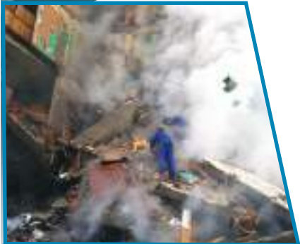
Жилой дом, взорванный террористами. Москва, улица Гурьянова, 1999 г.

ющей в данный момент в стране политической власти.