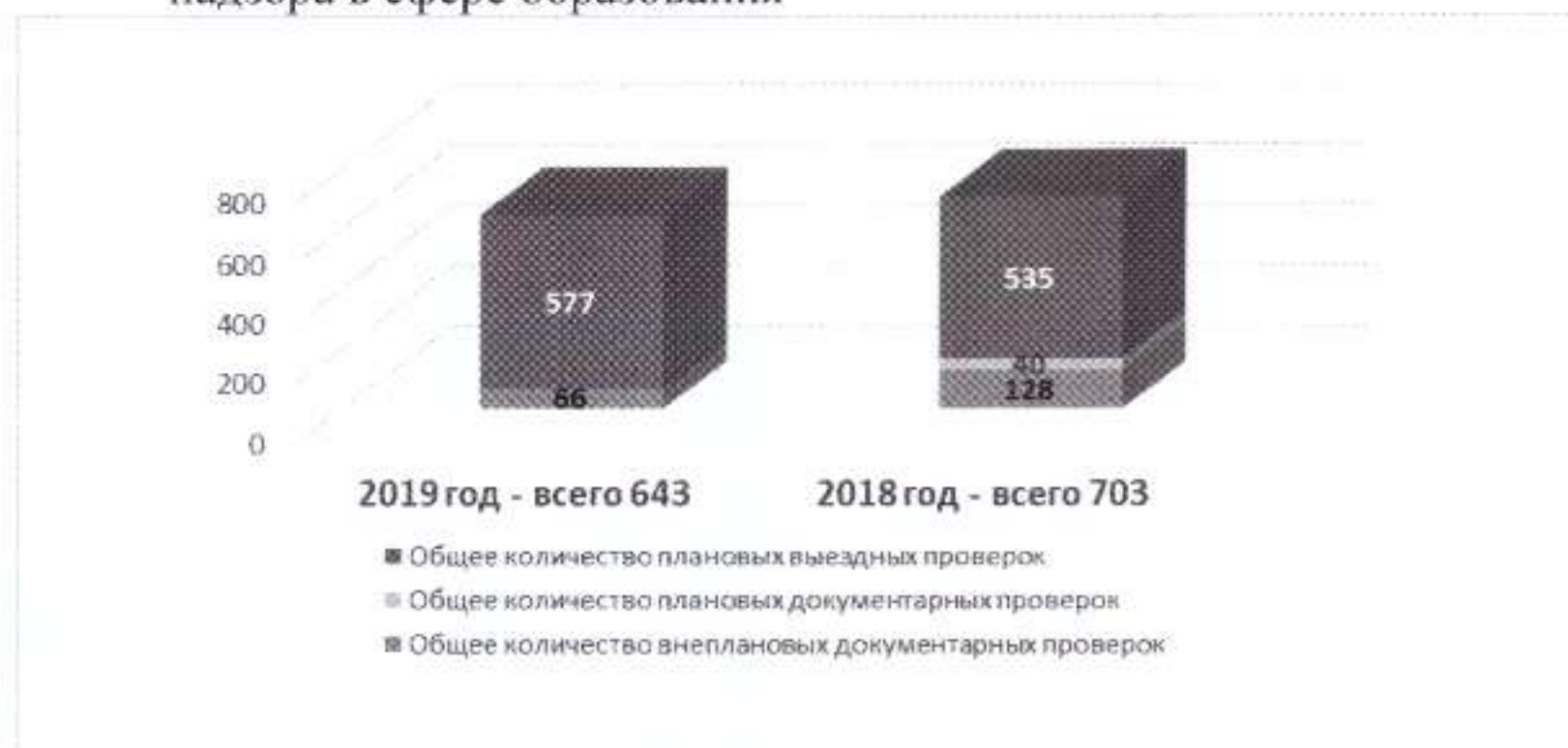
Рисунок 2. Выполнение работ по осуществлению федерального государственного надзора в сфере образования

В 2019 году общее количество объектов государственного контроля (надзора), в отношении которых Министерством проведены плановые и внеплановые проверки, - 597, в том числе: