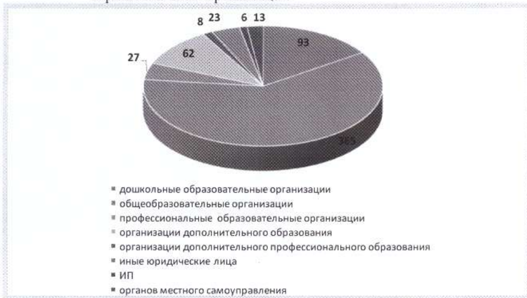
Рисунок 3. Количество объектов государственного контроля (надзора), в отношении которых проведены плановые и внеплановые проверки по типам образовательных организаций

Количество ликвидированных либо прекративших свою деятельность к моменту проведения плановой проверки юридических лиц, индивидуальных предпринимателей (из числа включенных в план проверок на отчетный период) составило 4.