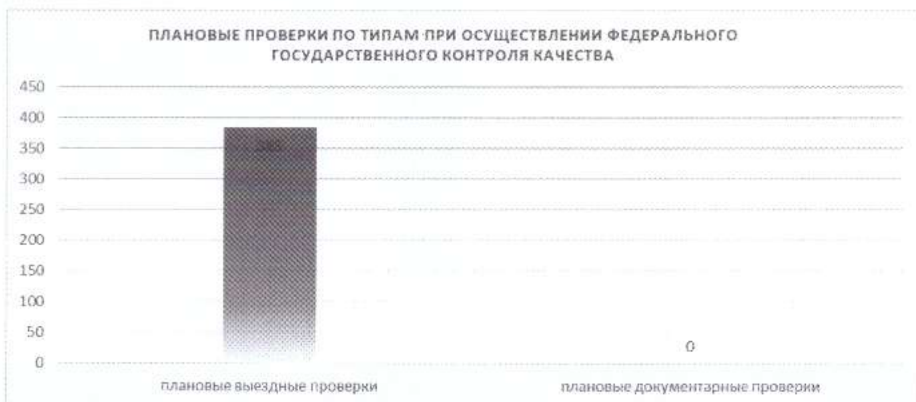
Рисунок 5. Количество проведенных плановых проверок по типам при осуществлении федерального государственного контроля качества

- количество плановых выездных проверок, - 385.