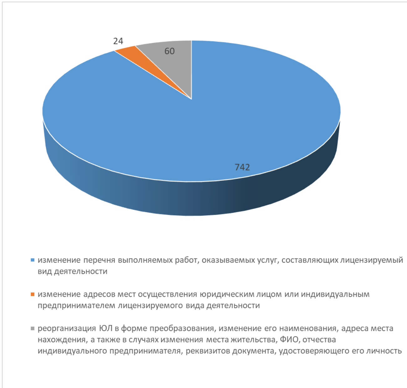
Рис. 3 Анализ заявителей в разрезе оснований переоформления лицензии

В 2021 году в отношении 20 соискателей лицензии принято решение об отказе в предоставлении лицензии.