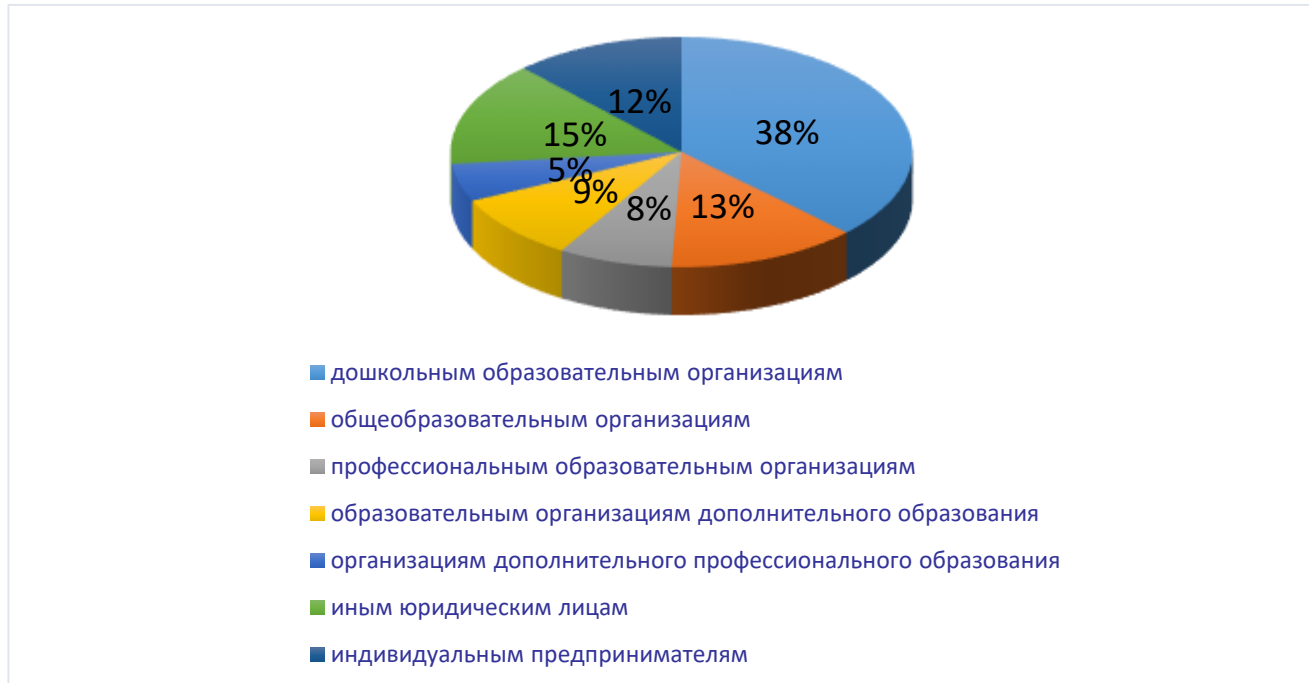
Рис. 2 Анализ заявителей в разрезе типов образовательных организаций

Как показывает анализ состава соискателей лицензии по типам организаций в 2021 году, наибольшую долю в составе соискателей лицензии занимают образовательные организации дошкольного образования (28), общеобразовательные организации (10) и иные юридические лица (11).